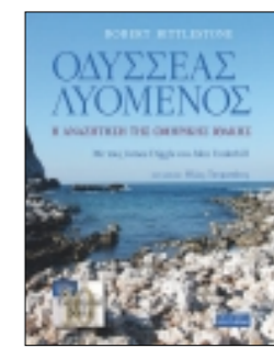
* Το βιβλίο του Ρόμπερτ Μπίτλοστοου «Οδυσσέας Λυόμενος. Η αναζήτηση της ομηρικής Ιθάκης» κυκλοφορεί από τις εκδόσεις Πολύτροπον.

Τι θυσίες χρειάζεται να κάνει ένας επιχειρηματίας, ιδιοκτήτης μιας εταιρείας, για να ακολουθήσει ένα τέτοιο project και πώς μπορεί να συνεισφέρει ένα επιχειρηματικό μυαλό σε μια επιστημονική δουλειά; «Η ενασχόλησή μου με τον «Οδυσσέα» ξεκίνησε το 2003. Σταμάτησα να βλέπω τηλεόραση και αφιέρωσα τις ώρες αυτές στο βιβλίο. Έτσι μπόρεσα να συνδυάσω το μεράκι μου με τη δουλειά μου, χωρίς να θυσιάσω τίποτα από τα δύο... Οι περισσότεροι επιχειρηματίες βρίσκονται στο φάσμα μεταξύ τεχνών και επιστημών και αυτό τους επιτρέπει να εισέρχονται στον επιστημονικό διάλογο, ακόμη και αν δεν είναι ειδικοί. Ο δικός μου ρόλος είναι να αμφισβητώ μια επιστημονική γνώμη, όχι επειδή πιστεύω ότι ξέρω περισσότερα, αλλά επειδή θέλω να ενθαρρύνω τον ειδικό να επανεκτιμήσει τις αποδείξεις του από την αρχή». ●