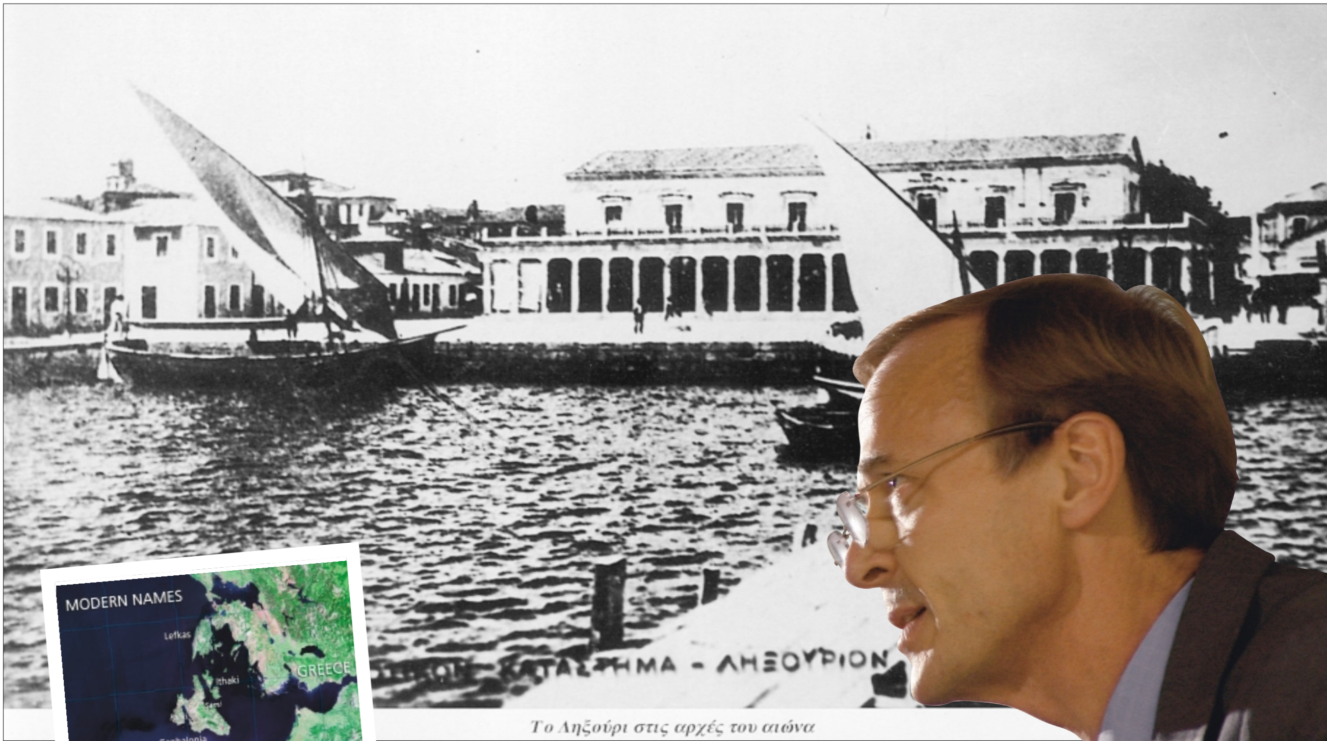
Το Ληξούρι στις αρχές του αιώνα

Ο συγγραφέας του «Οδυσσέα Λυόμενου» υποστηρίζει ότι η πατρίδα του ομηρικού ήρωα ήταν το κομμάτι της Δυτικής Κεφαλονιάς, η χερσόνησος της Παλικής δηλαδή, όπου βρίσκεται το Ληξούρι (κάτω). Το τμήμα αυτό αποτελούσε κάποτε ξεχωριστό νησί, αλλά λόγω της έντονης σεισμικής δραστηριότητας της περιοχής ενώθηκε με το ανατολικό κομμάτι.