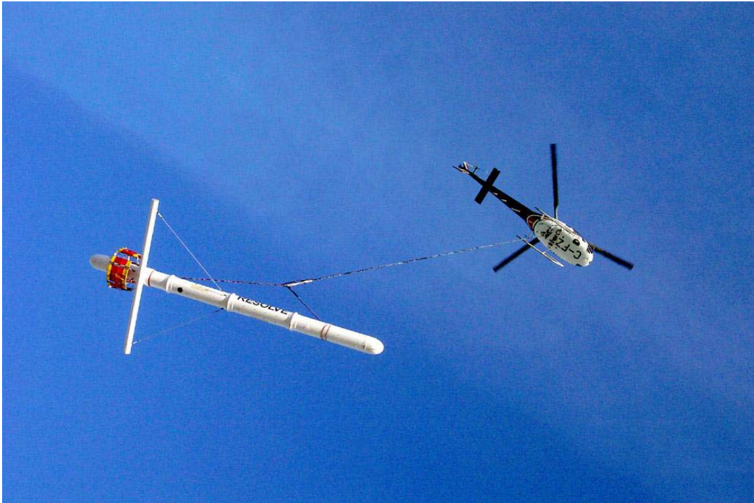
Fugro RESOLVE airborne electromagnetic survey system